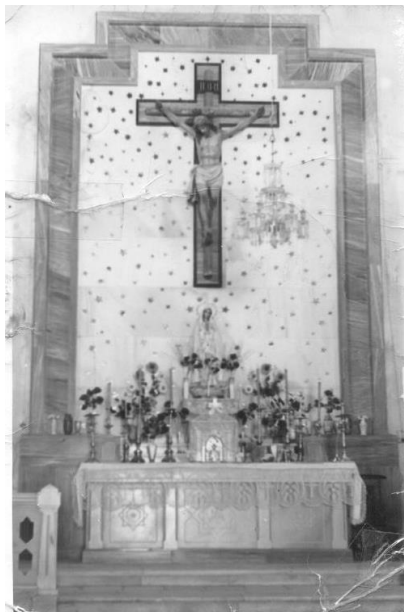
Fig. 4 Imagen del Altar Mayor. Año 1951

El interior lo compone una nave principal con una capilla lateral separada del Altar Mayor por un arco toral apuntado.