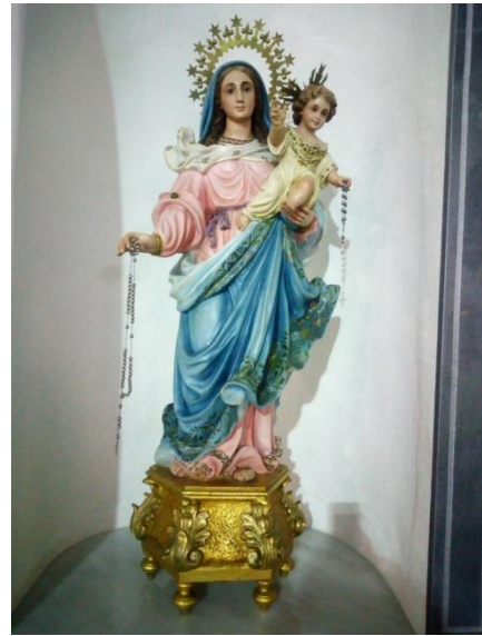
Fig.2 Nuestra Señora, la Virgen del Rosario, Patrona de Fines