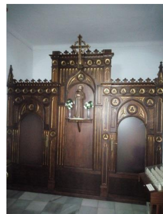
Fig.13. Detalle del confesionario