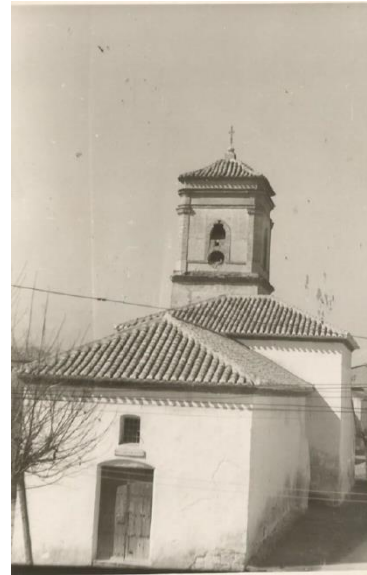
Fig.3 Imagen de la Iglesia en 1951

El interior lo compone una nave principal con una capilla lateral separada del Altar Mayor por un arco toral apuntado.