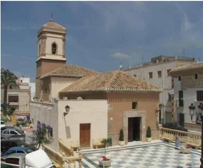
Fig.1 Iglesia Nuestra Señora del Rosario. Estado actual.