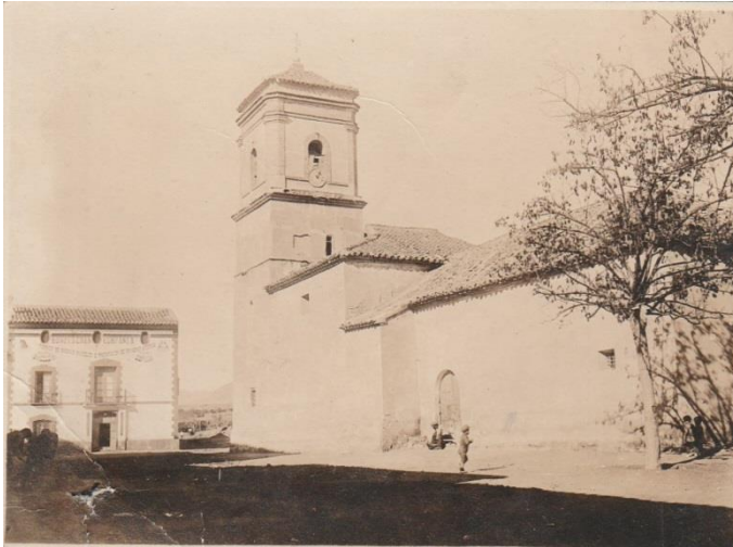
Fig.2 Imagen de la Iglesia años 20

La Iglesia, como todas las construidas después de la conquista en el Valle del Almanzora, Filabres y las Alpujarras, es de estilo mudéjar. Está edificada utilizando la combinación del ladrillo y los sillares para su construcción, así pues, el cuerpo principal del edificio utiliza sillares para darle solidez pero la torre campanario, compuesta de tres cuerpos separados por molduras, está construida en ladrillo para hacer la estructura más ligera y ganar altura.