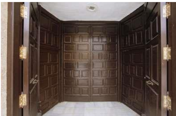
Fig. 8. Cancel de entrada

La entrada al templo se realiza a través de un cancel de cuatro hojas de cuarterones, las dos laterales con postigos, cada una de ellas pintada y barnizada en tonos marrones y compuestas por casetones rectangulares y cuadrados que se distribuyen por toda la superficie de una forma regular.