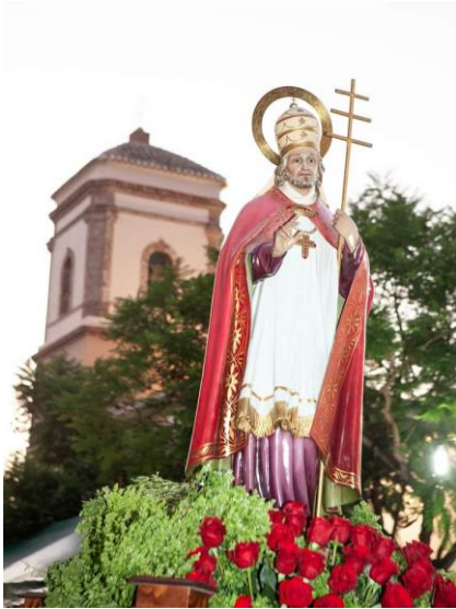
Fig.10. Nuestro Santo Patrón San Esteban

Figura masculina, coronada con la mitra papal y aureola de santidad. Se representa de pie, con una mano sujeta al báculo papal, mientras con la otra bendice. Viste túnica, saya y capa en las que predominan tonos rojizos, marrones, morados y blancos.