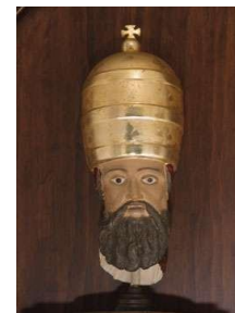
Fig.11 Cabeza del patrón San Esteban Fragmento que se conserva de la talla original del S.XVIII

Se trata de una cabeza policromada de figura masculina con barba, ojos expresivos y tocado como diácono. La composición, ordenada, presenta una gran frontalidad.