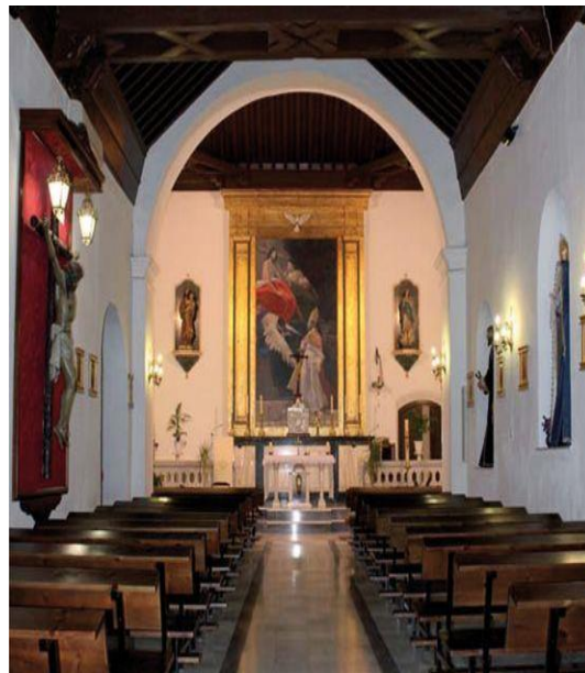
Fig. 5 Imagen del Altar Mayor. Estado actual. Obra del pintor Andrés García Ibáñez.