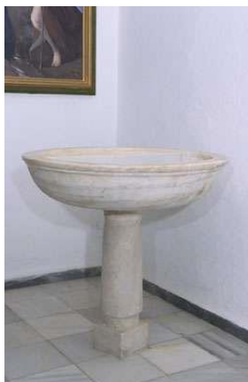
Fig.12 Pila bautismal circular de piedra blanca con vetas grises y ribete en el borde. Apoya sobre pedestal a modo de balaustre con basa cuadrada.